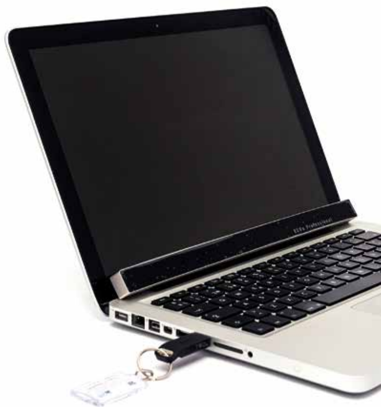
Equipo de eye tracking utilizado en la investigación.

interrogantes y en alianza con los semilleros de investigación Simipyme de Administración de Empresas, Neurociencias de Psicología, e Infografix de Comunicación Social, fueron motivados a realizar un estudio que permitiera identificar el nivel psicofisiológico que ejercen las imágenes publicitarias en la decisión de compra de cierta población, por medio de técnicas de neurociencias y el uso de dispositivos tecnológicos para recolección de datos como el polígrafo y el eye tracking fijo.