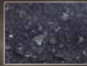
Asfalto y ceniza