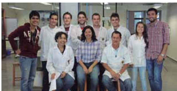
Equipo de investigación

“Obtuvimos una disminución o valores muy cercanos en los vacíos frente a las mezclas convencionales. La estabilidad mejoró, es decir, su capacidad de deformación es menor”, expresó la líder de Decor.