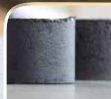
Briqueta Labor de compactación

En tres capas que se compactan con 25 golpes cada capa.