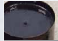
Ligante Elemento líquido o semisólido pegajoso, de color negro